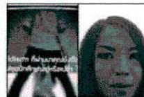
ศิลปินตัวจริงเสียงจริง "ฮิม เนโกะ" ไร่ขบวนแลนดี้ขุดนิกศึกษา