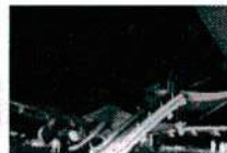
ขมสภาพเจ้าจามี่ หลังยางระเบิด