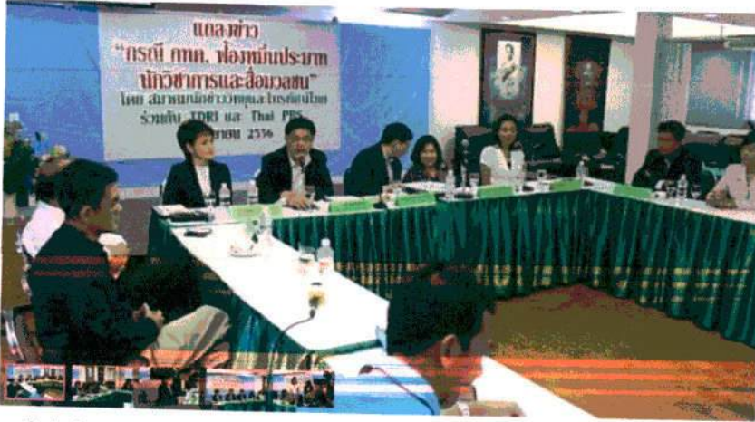
ส.นักข่าววิทยุและโทรทัศน์ ร่วมกับ TDRI และ TPBS ชี้แจง กรณี กทค.ฟ้องหมิ่นปรมาทนักวิชาการ-สื่อมวลชน

วันพฤหัสบดีที่ 5 กันยายน 2556 เวลา 13:08 น.