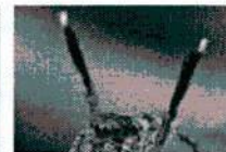
ไซรจากแมงมบนกตุง ระบาวาดสาว ออกสเด็ปขวนผสมหันธุ์