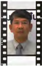
พลตรี อภิชาติ นพเม็อง